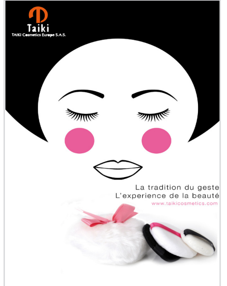
2012 Visuels institutionnels - Taiki Cosmetics Paris