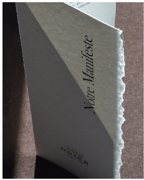
2011 Concept, graphisme du Manifeste - Maison Ogier

ALBERT BICHOT GRANDS VINS DE BOURGOGNE DEPUIS 1831 NOUS PARTAGEONS NOTRE TRÉSOR DEPUIS SIX GÉNÉRATIONS EN 1831, ALBERT BICHOT ÉCRIT LA PREMIÈRE PAGE DE L'HISTOIRE DE LA MAISON. LE TRÉSOR FAMILIAL S'EST CONSTITUÉ DEPUIS CETTE DATE DE CENT HECTARES DE VIGNES DANS LES TERROIRS ET LES CRUS LES PLUS PRESTIGIEUX DE BOURGOGNE. DES DOMAINES D'EXCEPTION. LE RESPECT DE LA NATURE, UN SAVOIR-FAIRE DE VINIFICATEUR-ÉLEVEUR CULTIVÉ DEPUIS SIX GÉNÉRATIONS NOUS PERMETTENT DE RÉVÉLER DANS CHACUN DE NOS VINS NOBLESSE ET ÉLÉGANCE. NOUS VOUS INVITONS À PARTAGER CE TRÉSOR EN FAISANT DE CHAQUE DÉGUSTATION UN AUTHENTIQUE MOMENT D'ÉMOTION. WWW.ALBERT-BICHOT.COM