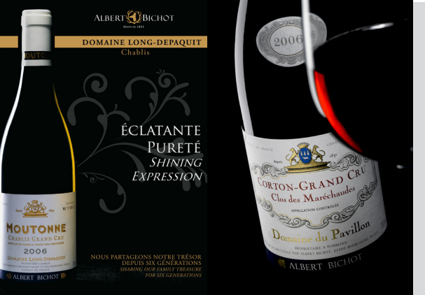
Depuis 2006 - Maison Albert Bichot Direction artistique globale, visuels pub, packshots, vidéos